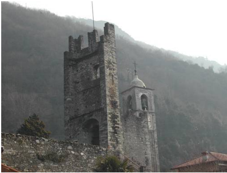
Torrione e Campanile